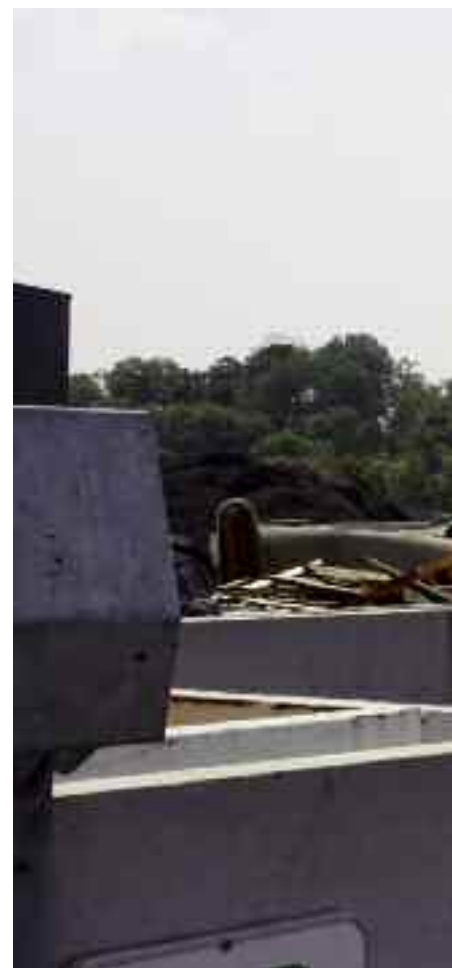
Un pic de fréquentation au début du printemps et à la fin de l'été

2007, c'est l'année de création de notre déchetterie communautaire. En un peu plus de deux ans, elle s'est imposée comme un élément important du dispositif de gestion des déchets pour tous les Caudaciens.