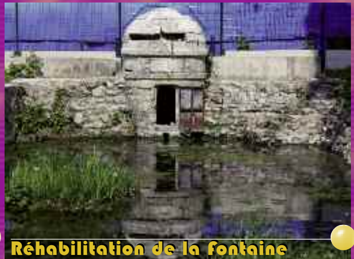
Réhabilitation de la fontaine