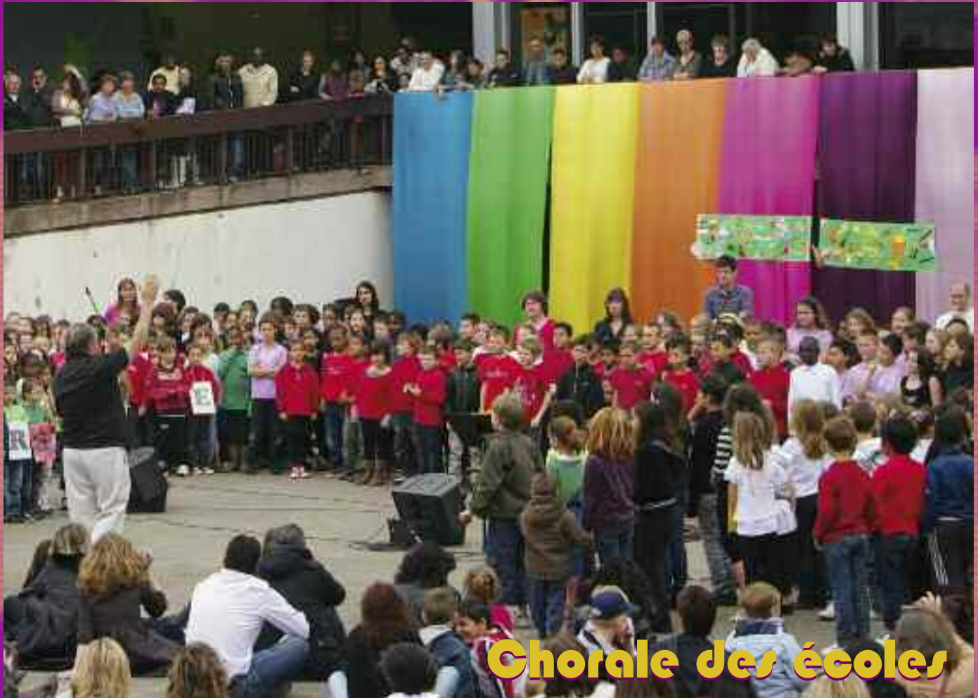
Chorale des écoles