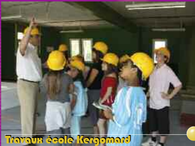
Travaux école Kergomard