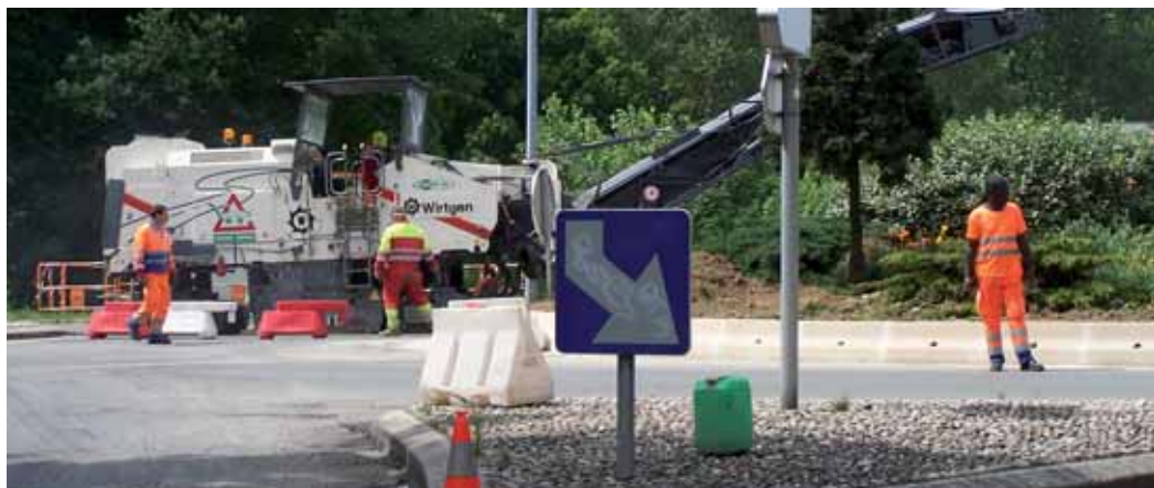
Rénovation du rond point des rues G.Pompidou et de l'hippodrome.

D'autres aménagements de rénovation sont en prévision au stade Robert Barran. Nous allons y refaire les deux courts de tennis l'éclairage