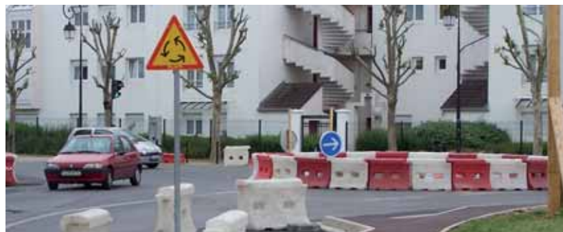
Réfection des trottoirs et de la rue de Bretagne (Marnières).

Convenus de longue date, les travaux réalisés sur l'Avenue de Bretagne vont permettre d'augmenter le confort aussi bien des