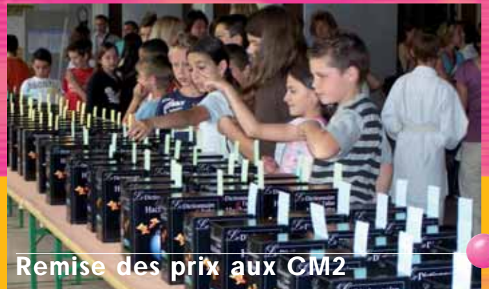
Remise des prix aux CM2