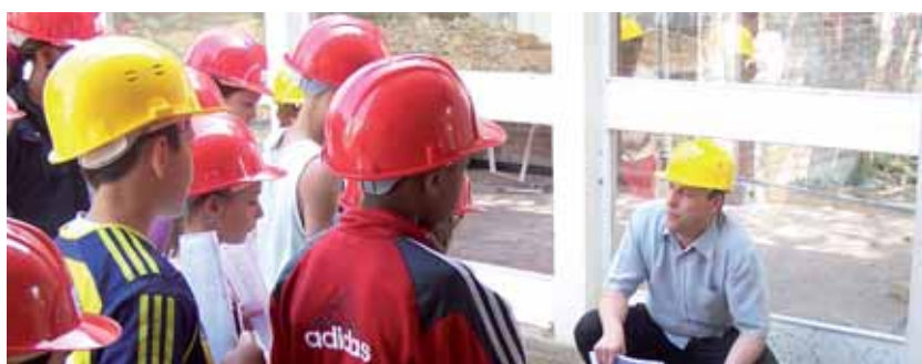
Les enfants de l'école Jean Zay participent à la construction de leur nouveau restaurant scolaire.

La Municipalité poursuit ses efforts budgétaires pour entretenir ou rénover les infrastructures et paysages de la ville. Ces efforts vont notamment en direction des groupes scolaires et équipements sportifs, mais aussi vers le fleurissement.