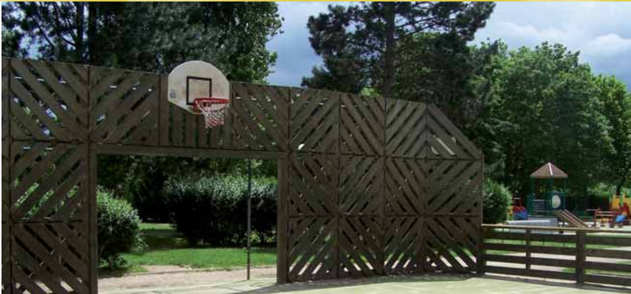
Cet espace situé sur la plaine de jeux va être totalement rénové.

automobilistes que des piétons. Pour un montant de 170 000 € (pris en charge par la CAHVM), la chaussée va être reprise, les trottoirs rénovés, les places de stationnement réaménagées, des ralentisseurs disposés et un sens giratoire au carrefour avec la route de Villiers.