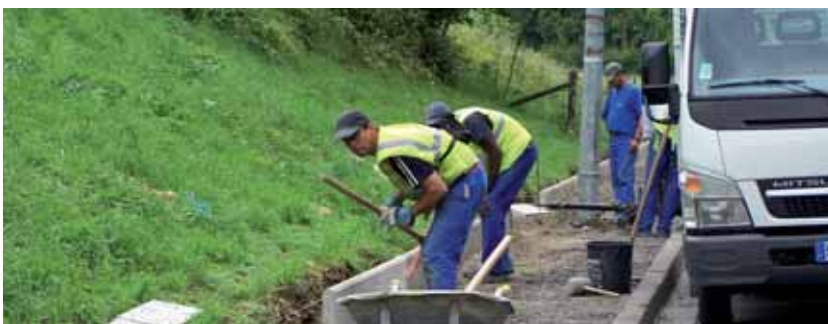
Création d'un trottoir route de la libération